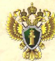
ПРОКУРАТУРА ГОРОДА САМАРЫ